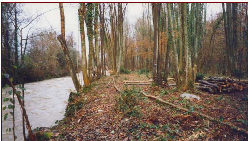
Coupe sélective sur les berges de l'Adour